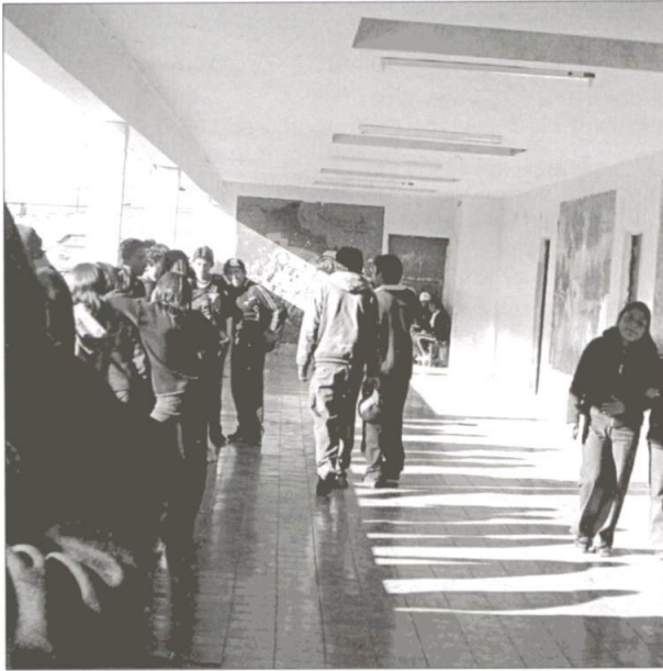
Colegio Martín Cárdenas Hermosa. Al fondo, un mural realizado por los estudiantes con la leyenda "Por nuestra cultura, todos los jóvenes nos ayudaremos".