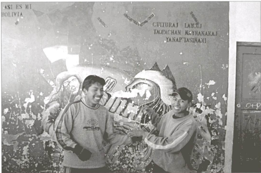
Sin pretender ser políticos, los estudiantes expresan sus preocupaciones, incluso en sus expresiones estéticas colegiales.